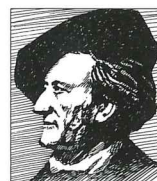
Richard Wagner 1813-1883 Germany Lohengrin WWV75