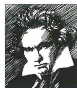
Ludwig van Beethoven 1770-1827 Germany Symphony No.9 D Minor Op.125