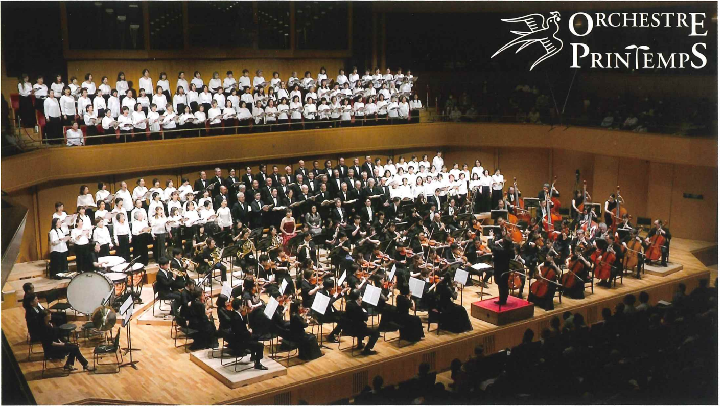
第22回定期演奏会 2024.9.8 愛知県芸術劇場コンサートホール

プランタン管弦楽団は2000年に結成されたアマチュアオーケストラで、毎年夏に定期演奏会を開催しており、今年で創立25周年を迎えます。団の節目となる今回の演奏会では、ハイドン最後の交響曲、マーラー最初の交響曲の2曲を演奏いたします。共にオーストリアで活躍した作曲家である彼らの作品のうち、マーラーの作品に取り組むのは今回が初めてとなります。当団にとって大きな挑戦ではありますが、皆様の心に感動を届ける音楽を目指して、日々練習に取り組んでおります。団員一同、皆様のご来場を心よりお待ちしております。