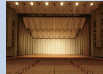
アートマネージメントは、劇場という空間を長いスパンでどう彩るかを考えることでもあります。

間に立つ、と言ってもただぼんやりとしている訳ではなく、どうすればより良い形で芸術家を鑑賞者に紹介できるか、またどうすれば鑑賞者にとってその芸術家や作品の体験が意義深いものになっていくか、更にはどうすればその文化施設のある地域にとって有意義な催事になるのか、そういったことをもろもろ考える。それがアートマネージメントです。