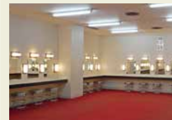
フォレストホール/地下楽屋