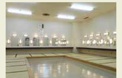
ビレッジホール/地下楽屋